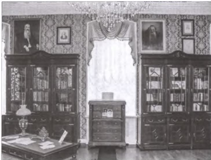
▲ При создании библиотеки-музея Н.Н. Стрхова исследователи не просто воспроизвели обстановку его кабинета, но также приобрели издания, стоявшие на полках его книжных шкафов