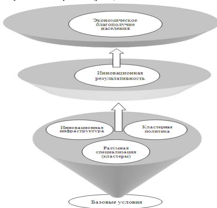
Рис. 2. Конусная модель конкурентоспособности региона

Анализ существующих подходов к влиянию кластеров на конкурентоспособность региона позволил нам предложить собственную конусную модель конкурентоспособности региона, основанную на взаимосвязи кластерного развития и экономического благополучия жителей региона (рис.2)