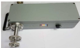
Рис. 2. Передвижная ультразвуковая стойка тарировки

Мы разработали и собрали рабочую модель мобильного ультразвукового эталонного блока для автоматической поверки бытовых счетчиков (рис. 2).