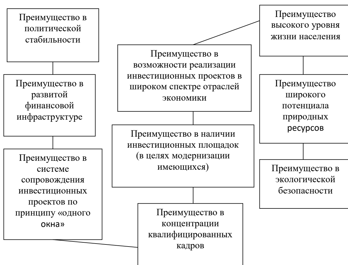
Рисунок 1 – Конкурентные преимущества Белгородской области [2, с.5]

Инвестиционная привлекательность Белгородской области основывается на следующих конкурентных преимуществах (рис. 1):