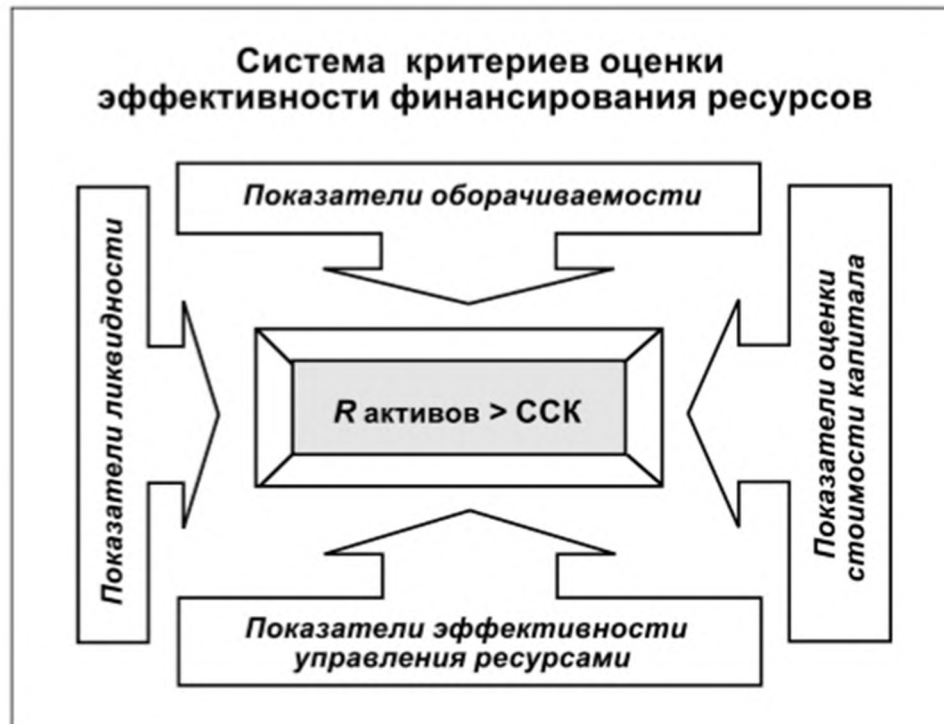
Рис. 2. Оценка эффективности использования финансовых ресурсов.