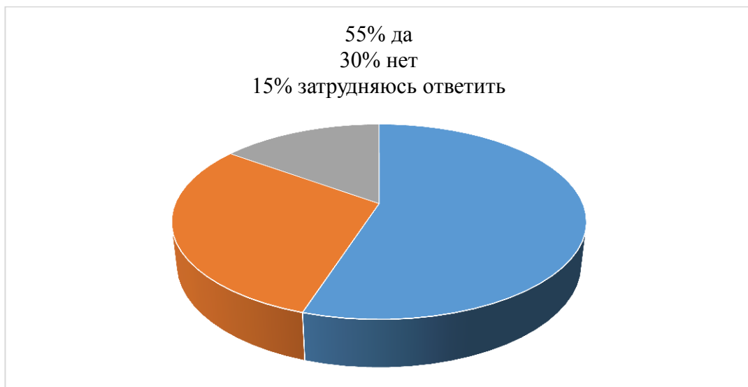
Рис 3. Распределение ответов на вопрос: «Считаете ли Вы необходимым законодательное закрепление мер воспитательного воздействия в отношении родителей (законных представителей)? «

Так же, нами был задан вопрос экспертам: "Считаете ли Вы необходимым законодательное закрепление мер воспитательного воздействия в отношении родителей (законных представителей)? " ответы распределились следующим образом (рис 3):