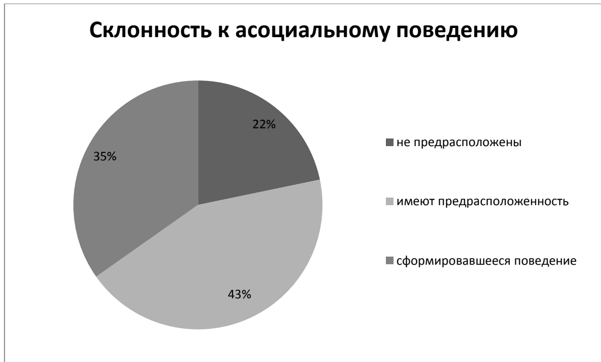
Рисунок 4. Склонность несовершеннолетних к асоциальному поведению.

Обобщая данные, можно сказать, что в среднем более половины опрошенных – 61% имеют склонность к девиантному поведению, 19% несовершеннолетних имеют уже сформировавшееся девиантное поведение и 20% не имеют склонности к проявлению девиантного поведения.