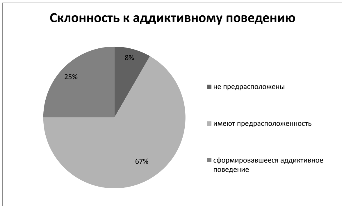
Рисунок 1. Склонность несовершеннолетних к аддиктивному поведению.

Анализируя склонность у воспитанников центра к аддиктивному поведению, к которому относят алкогольную, наркотическую, компьютерную, пищевую и иные виды зависимостей, можно сделать следующий вывод. Большинство опрошенных несовершеннолетних 67% имеют предрасположенность к зависимому поведению, четверть опрошенных имеют уже сформировавшееся аддиктивное поведение и лишь 8% не имеют к нему склонности (см. рисунок 1)