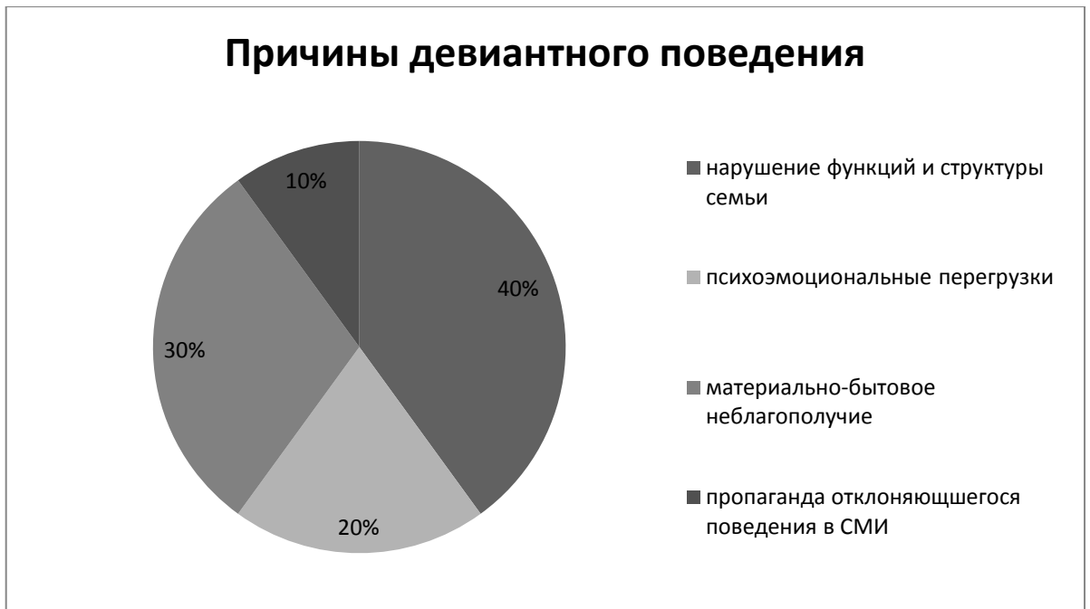
Рисунок 7. Причины проявления девиантного поведения несовершеннолетних по мнению сотрудников центра.

Проведя сравнительный анализ, можно сделать вывод о том, что организация отдыха, досуга, проведение различных оздоровительных мероприятий является одной из наиболее эффективных форм профилактической работы с несовершеннолетними.