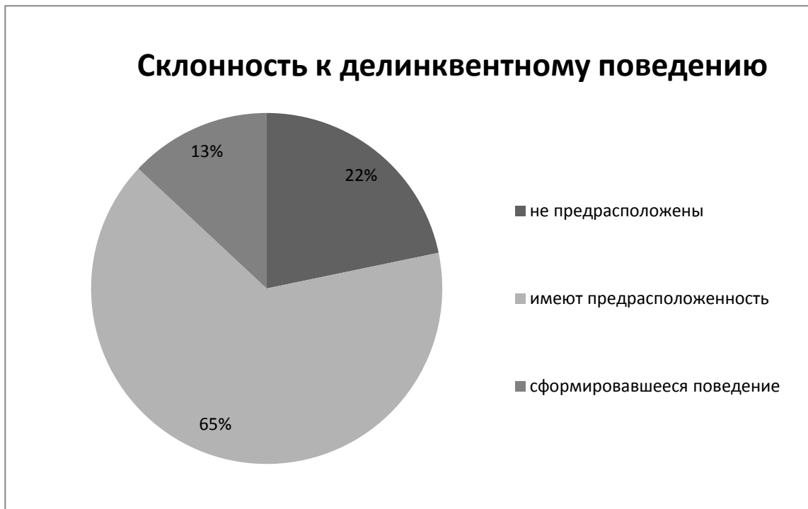
Рисунок 2. Склонность несовершеннолетних к делинквентному поведению.

Рассматривая склонность к делинквентному поведению, то есть, нарушению правовых норм, к примеру, воровство, хулиганство, вандализм, можно сделать вывод о том, что склонность к делинквентному поведению проявляется у 65% опрошенных несовершеннолетних, 22% не имеют предрасположенности к такого рода отклоняющемуся поведению и 8% имеют сформировавшееся делинквентное поведение (см. рисунок 2).