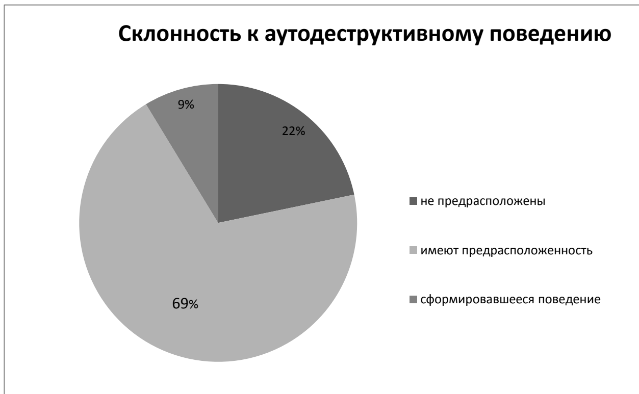
Рисунок 3. Склонность несовершеннолетних к аутодеструктивному поведению.

Также была проанализирована склонность воспитанников ОСГБУСОССЗН «Областной реабилитационный центр для несовершеннолетних» к проявлению асоциального поведения. Было выяснено, что 43% опрошенных имеют склонность к асоциальному поведению, 22% не предрасположены к нему и 35% имеют уже сформировавшееся асоциальное поведение (см. рисунок 4).