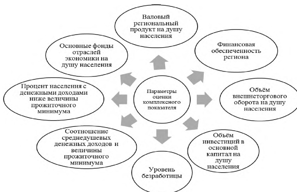
Рис. 1. Параметры оценки комплексного показателя социально–экономического развития региона