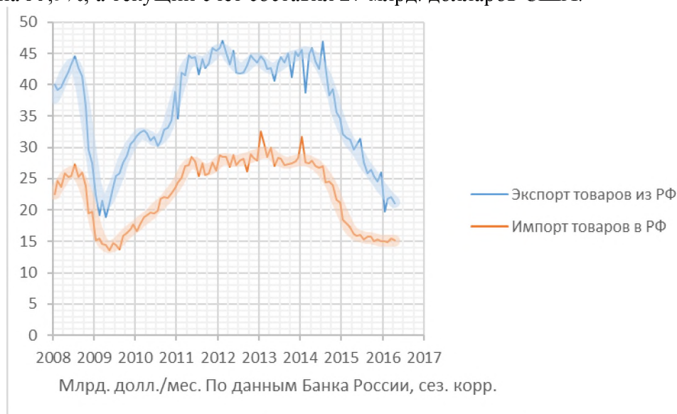
Рис. 4. Сальдо торгового баланса РФ

Чистый баланс денежных потоков из Российской Федерации значительно снизился. Специалисты связывают эту тенденцию с запретом на въезд в страны Европейского Союза и США для ведущих российских финансовых и экономических деятелей, а также представителей национального крупного бизнеса. С этой позиции, следует вывод о том, что персональные санкции поддержали российскую экономику и привлекли новые инвестиции в отечественную экономику от резидентов страны. Сальдо торгового баланса за 2016 год снизилось на 35,9%, а текущий счет составил 27 млрд. долларов США.