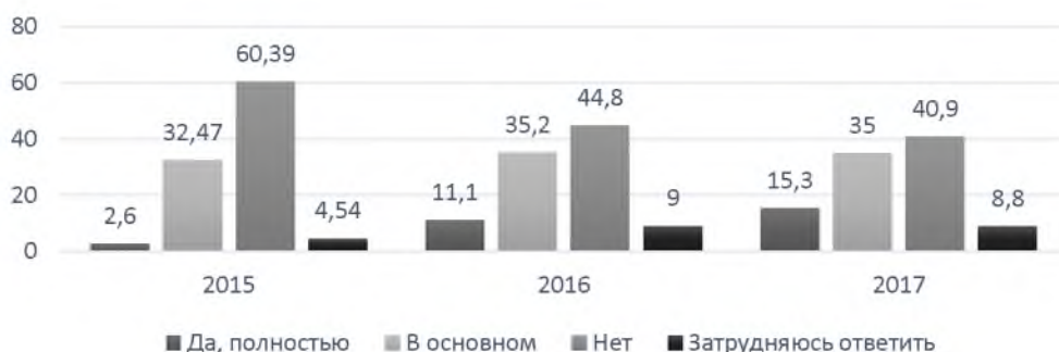
Рис. 1. Удовлетворенность студентов реализацией принципа социальной справедливости

Принцип справедливости и отношение к нему волновали нас с позиции наиболее прогрессивной группы молодежи – белгородского студенчества как двигателя социальных изменений, потенциала нашего региона. Говоря о показателе удовлетворенности реализацией принципа социальной справедливости у студенческой молодежи (исследования 2015, 2016, 2017 годов, N=3050), мы сталкиваемся с положительной динамикой, наиболее весомой по сравнению с предыдущими замерами. Так, группа полностью удовлетворенных ситуацией молодых людей достигла 15,3%, частично удовлетворенных респондентов стало 35,0%, снизилось количество неудовлетворенных реализацией этого принципа на 4% по отношению к 2016 году.