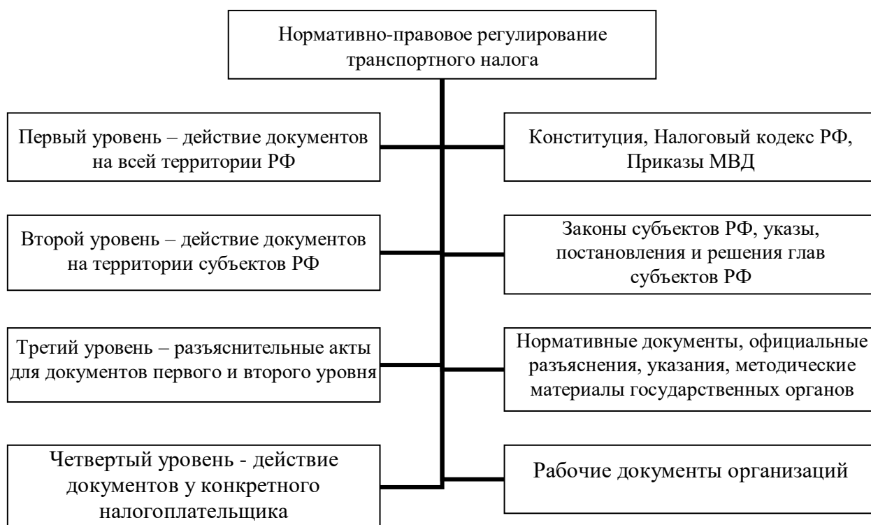
Рис. 1.1. Система нормативно-правового регулирования транспортного налога в Российской Федерации

нормативно-правового регулирования России состоит из 4 уровней. Наглядно она представлена на рисунке 1.1.