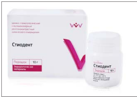
Рис. 2. Материал “Стиодент”

Растворимость материала “Стиодент” (рис. 2) при корректном приготовлении составила 1,160 \pm 0,081\% . Увеличение количества жидкости на 10% обусловило увеличение растворимости на 70% и достигло значений 1,973 \pm 0,147\% , что на 1% ниже рекомендованной ГОСТом границы. Увеличение жидкости на 20% привело к резкому увеличению растворимости до 3,898 \pm 0,322\% , что почти на 1% превышает пороговую величину, рекомендуемую ГОСТом (табл. 2).