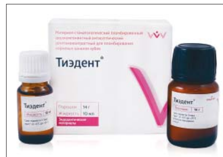
■ Рис. 1. Материал “Тизидент”

Материал “Тизидент” (рис. 1) продемонстрировал минимальную растворимость. При смешивании компонентов в соотношении, рекомендуемом производителем, его растворимость составила 0,057 \pm 0,016\% . Моделирование ситуации с превышением жидкости на 10% привело к пятнадцатикратному увеличению растворимости, а с превышением жидкости на 20% — к двадцатикратному, что составило 0,874 \pm 0,081\% и 1,146 \pm 0,231\% соответственно (табл. 1).