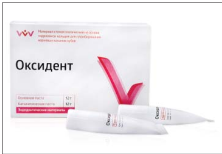
Рис. 3. Материал “Оксидент”

Растворимость материала “Стиодент” (рис. 2) при корректном приготовлении составила 1,160 \pm 0,081\% . Увеличение количества жидкости на 10% обусловило увеличение растворимости на 70% и достигло значений 1,973 \pm 0,147\% , что на 1% ниже рекомендованной ГОСТом границы. Увеличение жидкости на 20% привело к резкому увеличению растворимости до 3,898 \pm 0,322\% , что почти на 1% превышает пороговую величину, рекомендуемую ГОСТом (табл. 2).