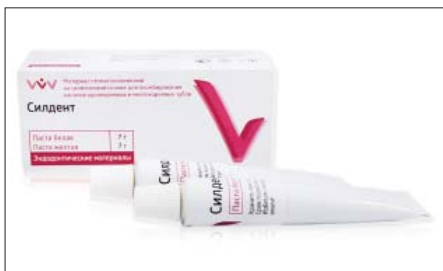
Рис. 4. Материал “Силдент”

В норме показатель растворимости материала “Оксидент” (рис. 3) составил 1,857 \pm 0,150\% . Десятипроцентное увеличение базовой пасты привело к увеличению растворимости на 25,14%. При этом растворимость материала всё же удовлетворяла требованиям ГОСТа. Двадцатипроцентное увеличение базовой пасты обусловило значительное увеличение растворимости — до 4,320 \pm 0,315\% . Это значение на 1,32% превышает границу, установленную ГОСТом (табл. 3).