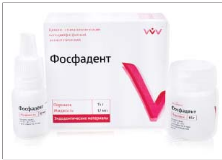
Рис. 5. Материал “Фосфадент”

Наибольшую растворимость продемонстрировал материал “Фосфадент” (рис. 5). При рекомендуемом соотношении компонентов она равнялась 2,209 \pm 0,202\% . Увеличение на 10% количества жидкости привело к увеличению растворимости