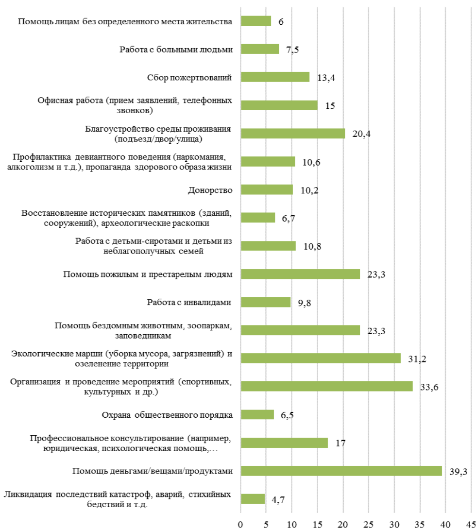
Рисунок 1 – Волонтерские практики студенческой молодежи, % Figure 1 – The voluntary practice of student youth, %

Говоря о проблемах в области культурного досуга, порядка 25% указали на отсутствие мест для такого досуга, отсутствие его организации в местах своего проживания и около 6% обозначили такие проблемы в университете.