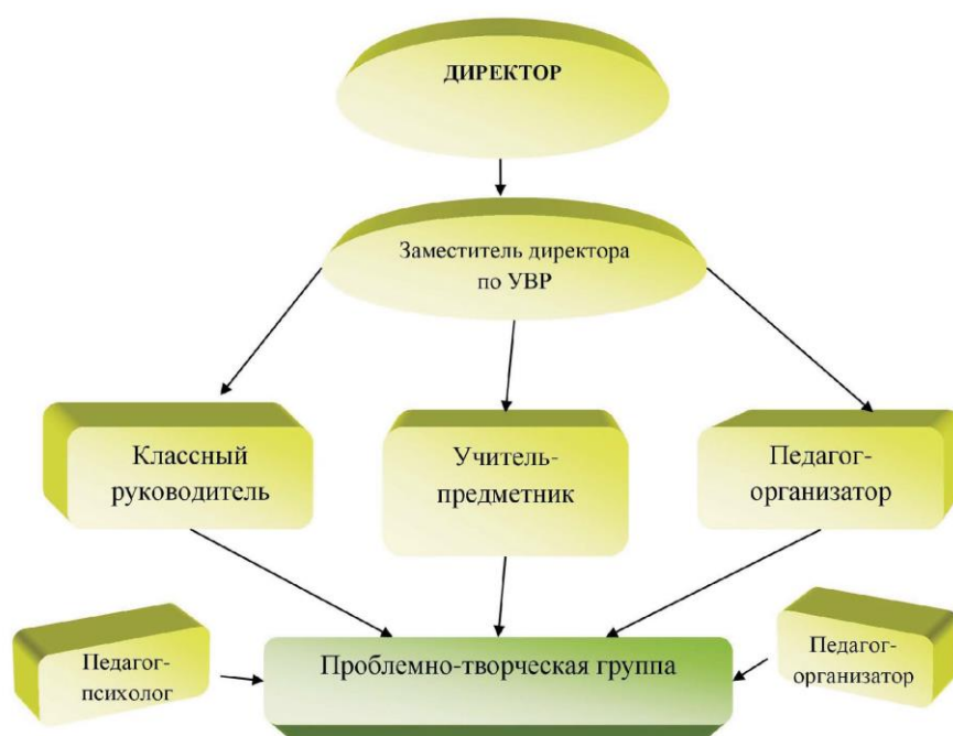
Рис. 1. Схема взаимодействия участников образовательного процесса в период адаптации детей мигрантов

На уровне обучения формируются дифференцированные группы для внеурочных занятий по русскому языку или организуются индивидуальные занятия. Педагоги проблемно-творческой группы разрабатывают индивидуальные образовательные траектории для погружения детей в предметную языковую среду с учетом уровня знаний, психологических особенностей и закономерностей этнокультурной адаптации, используя разработанные учебники по русскому языку и литературному чтению для детей-мигрантов и переселенцев, а также методики преподавания русского языка и литературы.