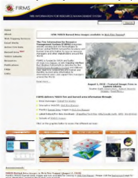
Рисунок 1 - Интерфейс системы FIRMS

Пример интерфейса системы мониторинга представлена на рисунке 1.