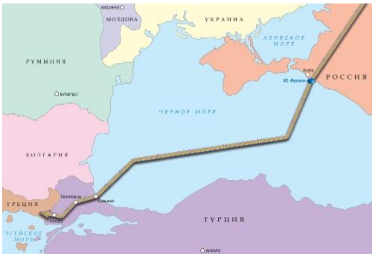
Рис.2.2. Карта проекта поставок сырья по Трансбалканскому трубопроводу. Поставки должны были идти из морского терминала в Новороссийске на территорию Турции.