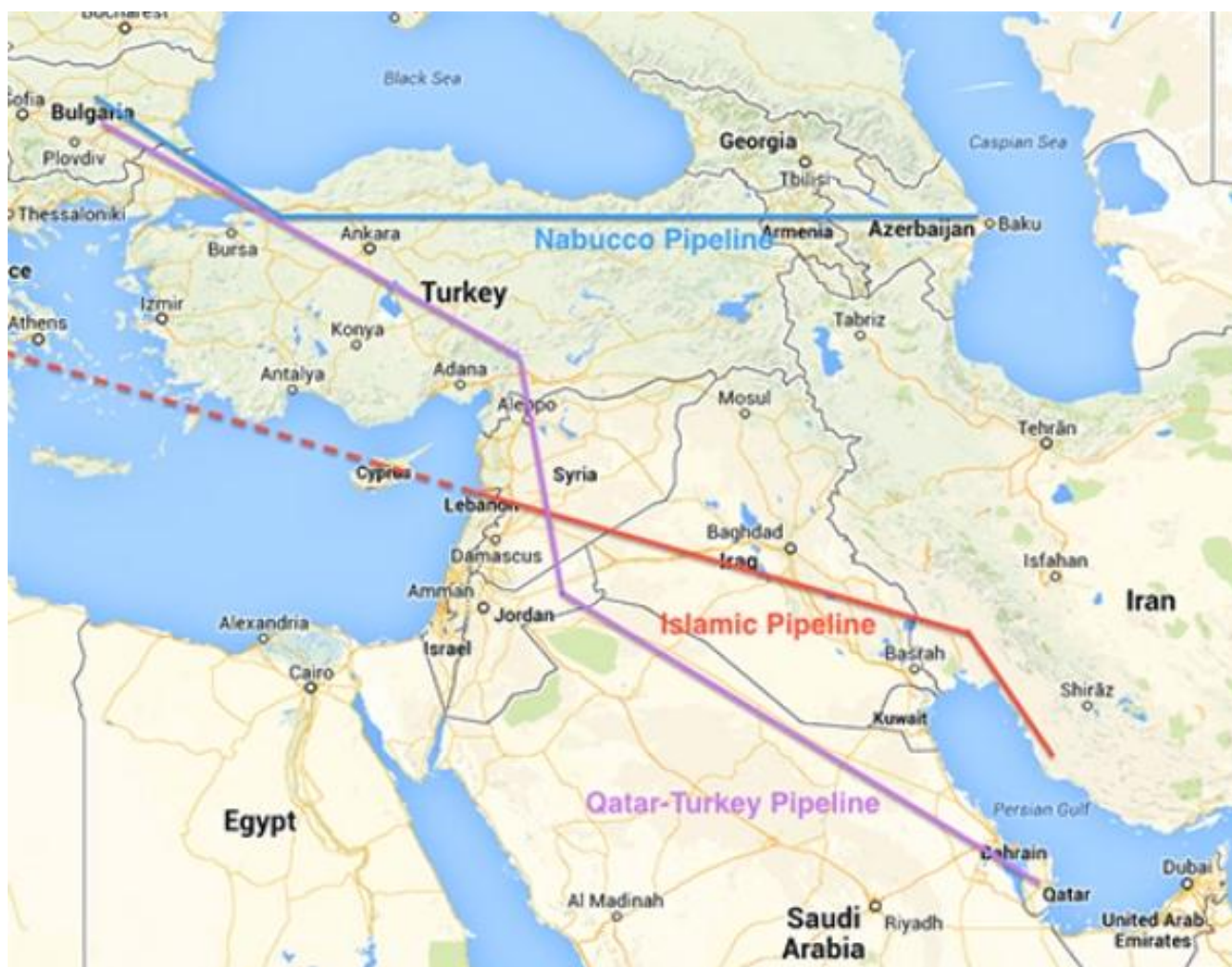
Рис.2.3.Карта проекта транспортировки чистого газа по суше из Катара и Ирана через территорию Сирии.