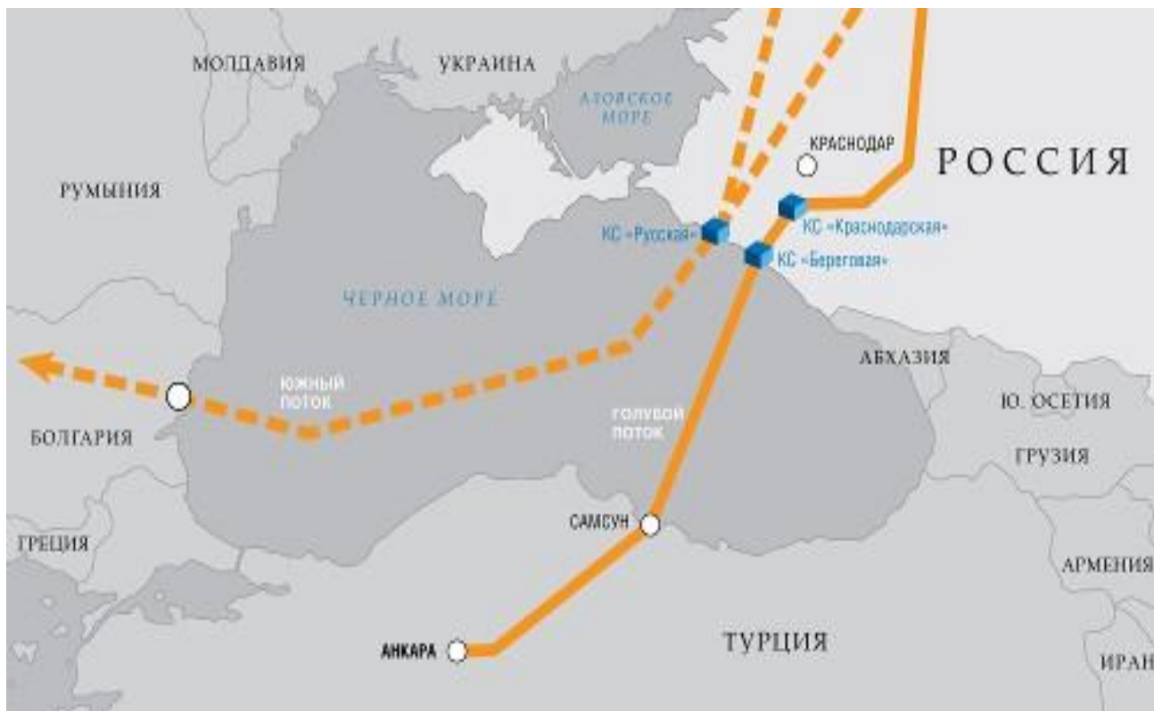
Рис.2.1. Карта пути газопровода между Россией и Турцией. В 2007 году «Голубой поток» был одним из самых крупных проектов поставки сырья в Турцию. Существовал большой денежный оборот, около 1 миллиарда рублей в год.