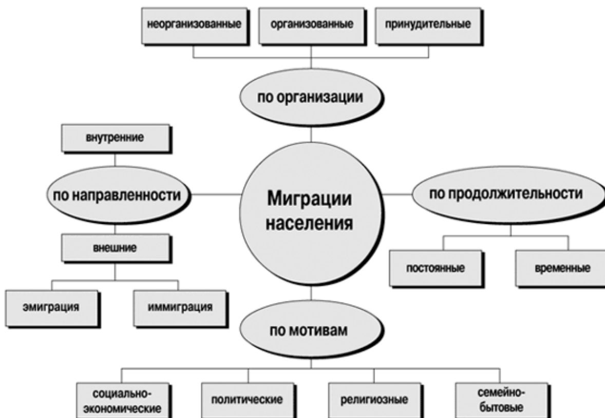
Рис.1.1 Виды миграции населения