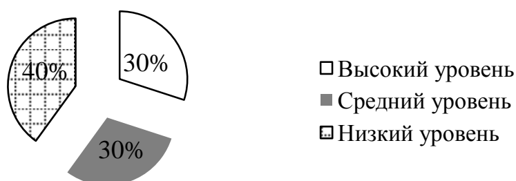
Рис 2.2. Результаты уровня развития навыков диалогического общения у детей старшего дошкольного возраста.

Результаты диагностического исследования мы представили в виде диаграммы. Из диаграммы следует, что у 3 детей навыки диалогического общения сформированы на «высоком уровне» (30%), на «среднем уровне» находятся 3 детей, что составляет 30%, а на «низком уровне» 4 ребенка (40%). Результаты представлены на рис 2.2.