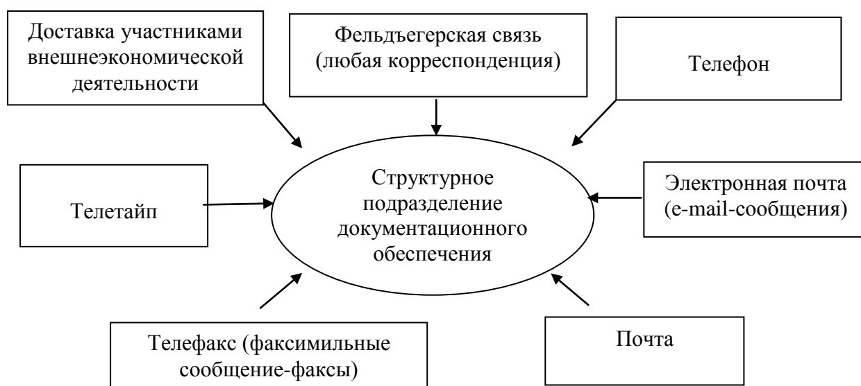
Рис. 1. Способы доставки поступающей корреспонденции в структурные подразделения единой системы таможенных органов Российской Федерации

В настоящее время, источниками корреспонденции, поступающей в таможенные органы, являются средства почтовой, фельдъегерской, специальной и электрической связи, которые представлены на рисунке 1.