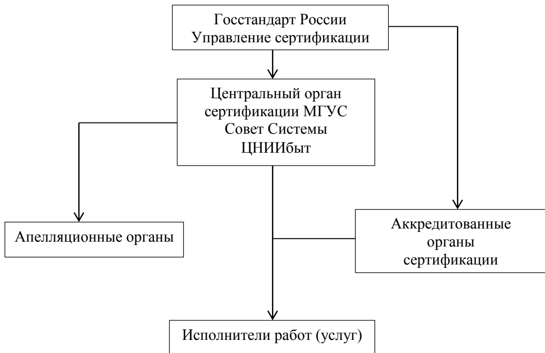
Рис. 1.1. Структура системы сертификации парикмахерских услуг

Объектами сертификации являются следующие услуги парикмахерских: услуги по уходу за волосами (с применением и без применения химических препаратов), косметические услуги, в том числе услуги по декоративной косметике, услуги по уходу за кожей лица и тела, массаж, услуги по уходу за кожей кистей рук и стоп, ногтями (маникюр, педикюр) за исключением услуг, связанных с нарушением целостности кожных покровов, требующих врачебного контроля, и постижерные работы [20].