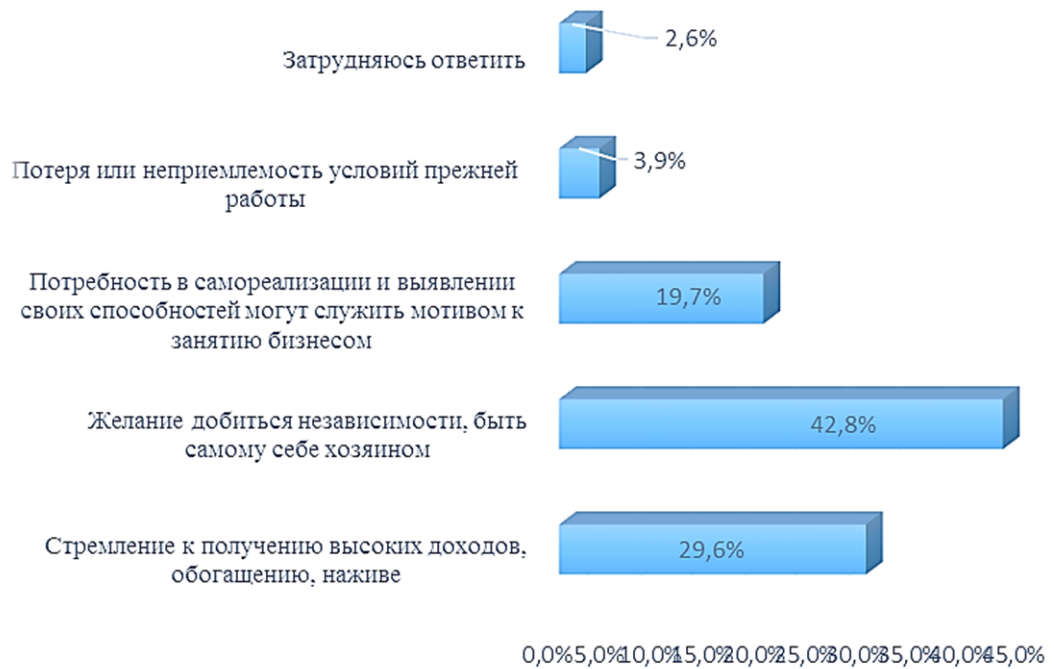
Диаграмма 3. Распределение ответов на вопрос № 10 «Как Вы считаете, что является мотивом к открытию собственного бизнеса?»

В начале исследования была выдвинута гипотеза о том, что мужчины в большей степени ориентированы на создание собственного бизнеса, чем женщины.