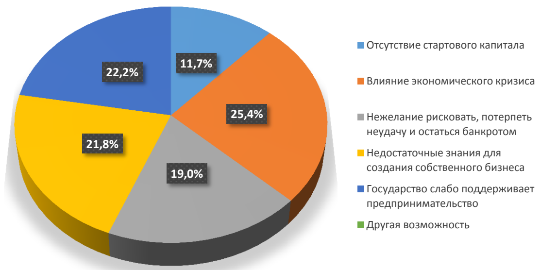
Диаграмма 5. Распределение ответов на вопрос № 25 «На Ваш взгляд, какие могут быть причины отказа от идеи создания собственного бизнеса?»

Таким образом, можно сделать вывод, что на сегодняшний день люди готовы заниматься бизнесом, но для реализации своих идей им не хватает стабильности в экономике страны, поддержки государства и знаний в области бизнеса.