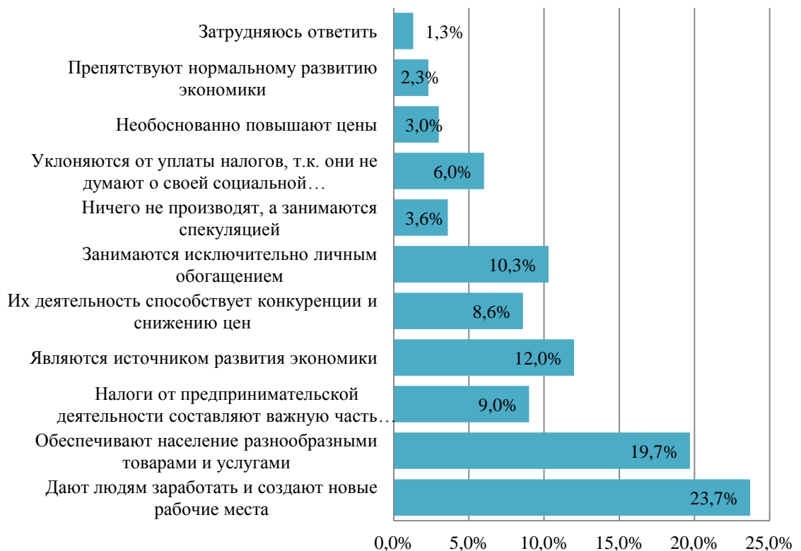
Диаграмма 2. Распределение ответов на вопрос № 6 «Как Вы оцениваете роль бизнесменов в обществе?»

обеспечивают население разнообразными товарами и услугам, 12% – считают, что бизнес и его представители, являются источником развития экономики, 10,3% респондентов посчитали, что бизнесмены заниматься исключительно личным обогащением, 9% – ответили, что налоги, которые приносит бизнес, составляют важную часть бюджета страны, 8,6% участников исследования считают, что деятельность бизнесменов способствует конкуренции и снижению цен, 6% – посчитали, что бизнесмены уклоняются от налогов тем самым не думают о своей социальной ответственности перед обществом, 3,6% респондентов считают, что предприниматели ничего не производят, а занимаются спекуляцией, 3% опрошенных решили, что представители бизнеса необоснованно повышают цены, 2,3% участников исследования считают, что бизнесмены мешают нормальному развитию экономики и у 1,3% респондентов этот вопрос вызвал затруднение с ответом.