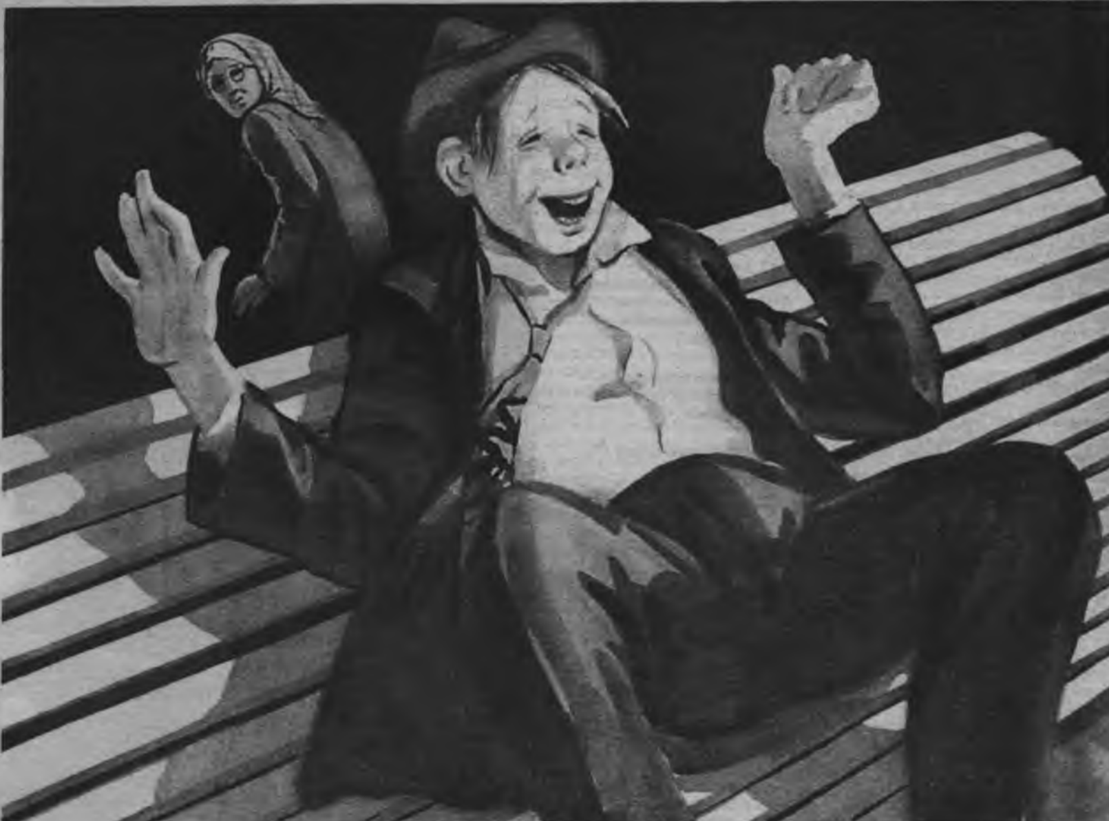
Плакат «Баловали с детства сына» (Анатолий Мосин, 1957 год)

Вот и выросла дубина... Что посеешь, то пожнёшь!