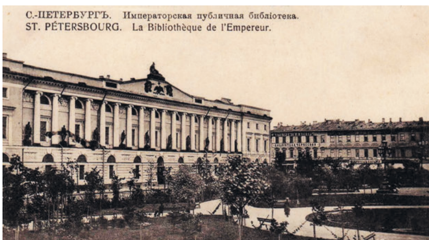
Императорская публичная библиотека Санкт-Петербурга, фото конца XIX-начала XX века