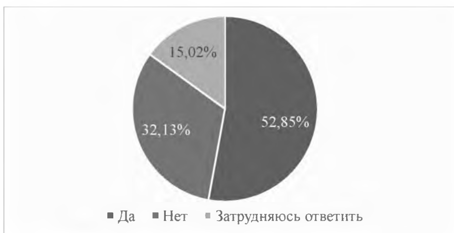
Рис. 4. «Как Вы считаете, отличается ли развитие средних и малых городов приграничных регионов от развития муниципалитетов центральных регионов?»