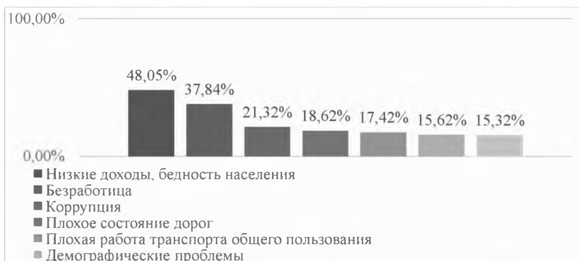
Рис. 1. «Какие наиболее острые проблемы стоят сейчас перед средними и малыми городами приграничных регионов? (укажите не более 3-х вариантов ответа)»

Вместе с тем, в рамках исследования, респонденты определили и наиболее острые социальные проблемы (рис. 1). На первое место жители города поставили низкие доходы и бедность населения (48,05 %). Второй по значимости проблемой респонденты назвали безработицу (37,84%). Кроме того, опрошенные часто отмечали коррупцию (21,32%), плохое состояние дорог (18,62%), плохую работу транспорта общего пользования (17,42%).