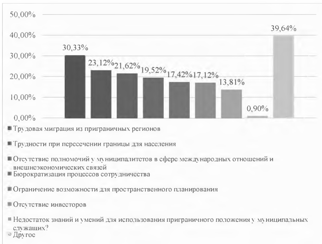
Рис. 5. «Определите конкретные отличия в развитии города Белгорода и внутренних городов страны»