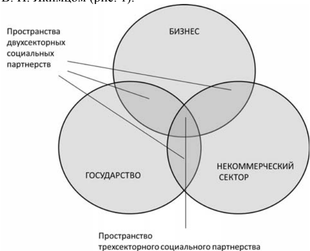
Рис. 1. Пространство трехсекторного социального партнерства

Наиболее удачное схематичное отображение межсекторного социального партнерства, которое отражает и специфику действий и взаимодействий в системе социальной защиты населения, представлено В. Н. Якимцом (рис. 1).