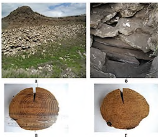
Рисунок 1. Стратиграфия археологического раскопа кургана Ак-Кая IX (а); дубовые бревна в погребении IV в. до н.э. (б); спилы бревна (в, г)

Под насыпью кургана Ак-Кая IX (Белогорский район) было сделано 2325-2350 лет назад [2] перекрытие склепа из бревен молодых дубов (рис. 1). Это позволило получить серии кернов из уникальной по сохранности древесины для последующих дендрохронологических исследований. Мы также отобрали 38 кернов из стволов живых деревьев преимущественно дуба (три вида) со средним возрастом 56 лет (от 22 до 97) в близлежащих к кургану лесных массивах (рис. 2). Керны были получены в сентябре 2016 года с помощью приростного бурава Пресслера (Haglöf 400 mm). Измерения ширины годовичных колец проведены в соответствии с общепринятой методикой на устройстве для измерения годовичных колец LINTAB-6 (с точностью 1 \cdot 10^{-3} мм) в комплекте с платформой TSAP-Win (Professional 4.0).