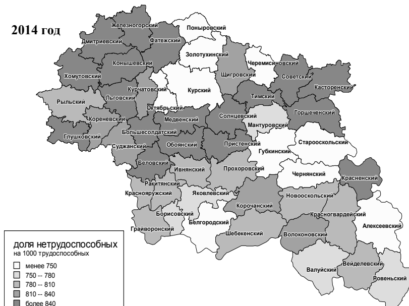
Рис. 1. Нагрузка нетрудоспособными лицами трудоспособного населения

Таким образом, за исследуемый период в основном на территории Курской области наблюдается старение возрастного состава населения, от центра к периферии, а также увеличение общей демографической нагрузки на трудоспособное население, посредством увеличения доли пожилых возрастов и снижения доли детей и подростков. Применительно к населению в трудоспособных возрастах характерно наличие процессов демографической деградации. В Белгородской области обстановка намного лучше, т.к. только один Красненский район отличается высоким уровнем демонагрузки. Это объясняется наличием в большинстве районов высокой доли населения трудоспособных возрастов.