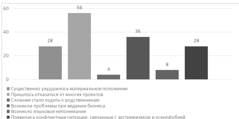
Рис. 1. В чем проявляется влияние новообразованной государственной границы между Россией и Украиной на развитие приграничных регионов? (%)

В следующем вопросе было исследовано насколько респонденты информированы о существовании совместных российского-украинских еврорегионов. 40% опрошенных знают о том, что некоторые области России и Украины объединены в еврорегион, 35% ответили на этот вопрос «Нет», а еще 25% не смогли ответить (Табл. 2).