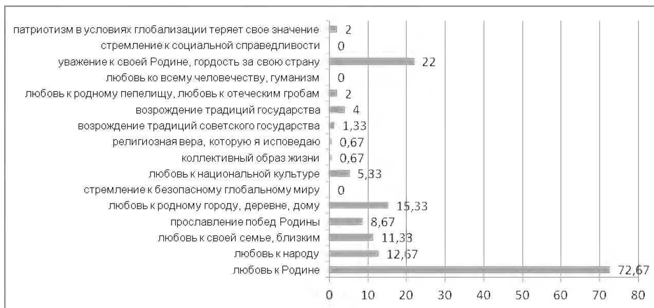
Рис. 1. Ответы респондентов на вопрос: «Что такое, на Ваш взгляд, патриотизм?»

Можно констатировать, что молодежь, в большинстве своем понимает патриотизм как «любовь к Родине» (72,67%). В свою очередь, смысловое наполнение этой категории содержит в 22% случаев такие характеристики как уважение к ней и гордость за свою страну. Вторым вариантом молодые люди обычно выбирают любовь к малой родине, своему дому (15,33%), любовь к народу (12,67%), любовь к своим близким (11,33%).