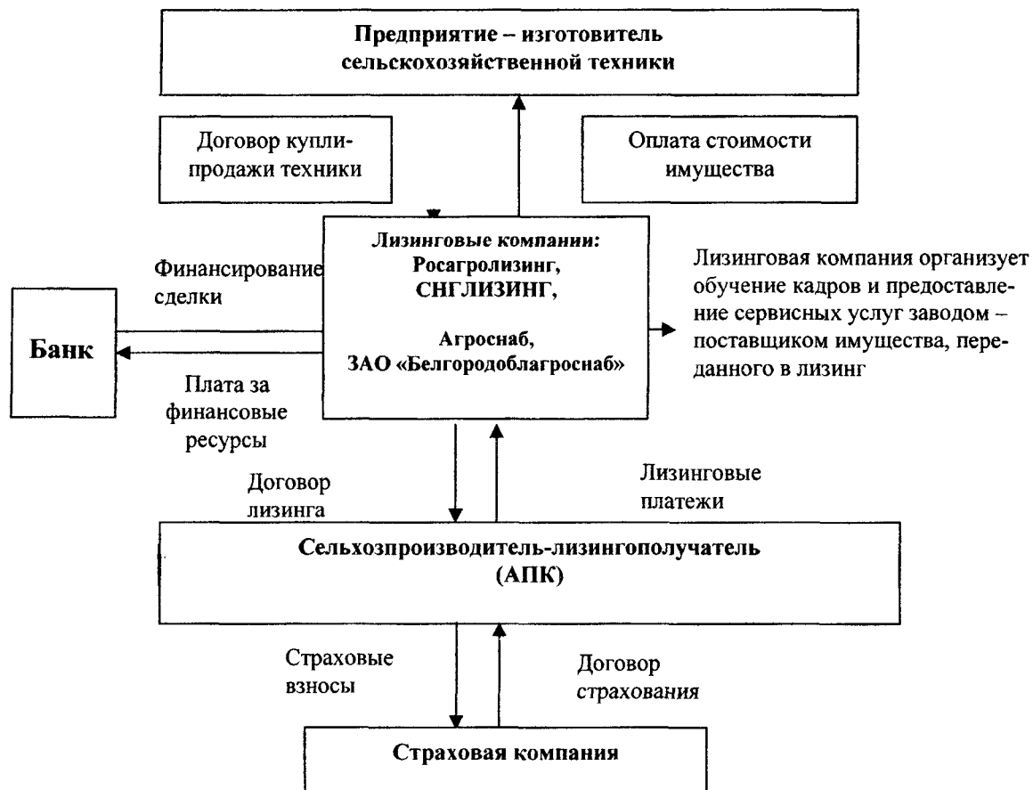
Рис. 3. Модель движения финансовых средств по договору агролизинга

Предложенная нами модель предусматривает развитие межгосударственного лизинга сельскохозяйственной техники и машин на основе Программы «СНГАГРОМАШЛИЗИНГ – 2010», участниками которой являются: соответствующие научно-исследовательские учреждения; заводы-изготовители; предприятия, эксплуатирующие данное оборудование и осуществляющие его ремонт; банки и другие кредитно-финансовые учреждения, ведущие расчетно-кассовое и инвестиционное обслуживание хозяйствующих субъектов данного сегмента рынка; лизинговые и страховые компании, заинтересованные в лизинге и страховании данного оборудования.