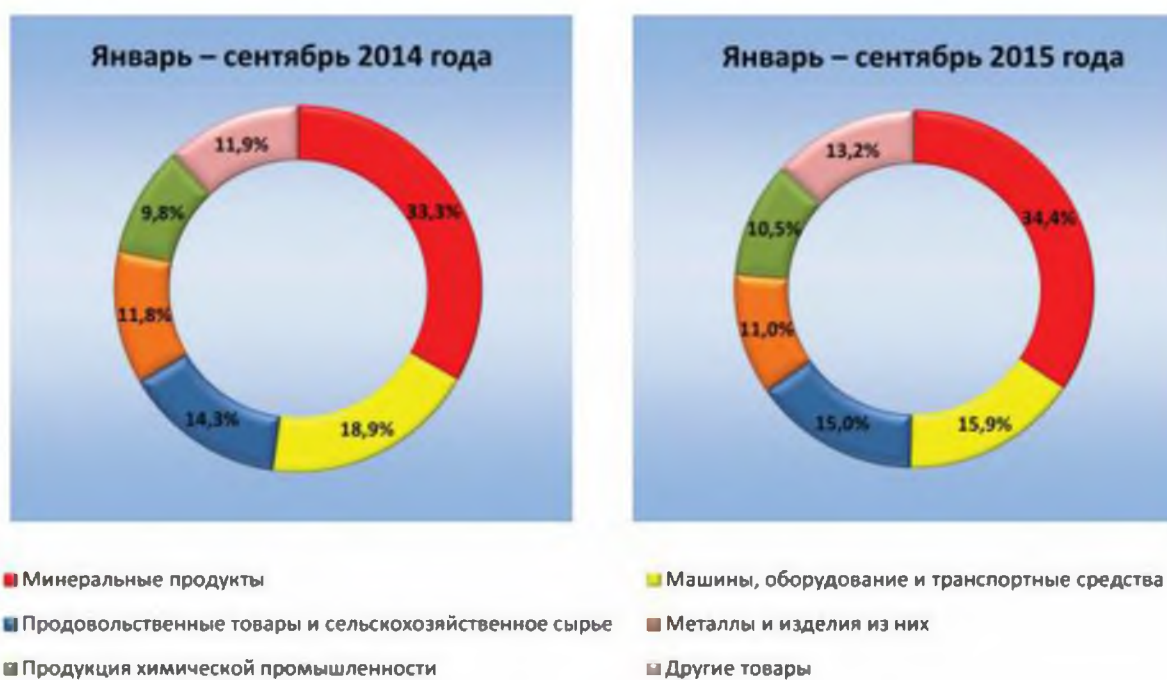
Рис. 2. Структура взаимной торговли стран ЕАЭС, 2014-2015 гг.

Структуру взаимной торговли по укрупненным товарным группам за январь — сентябрь 2014 и 2015 годов (в процентах к итогу) характеризует рисунок 2.