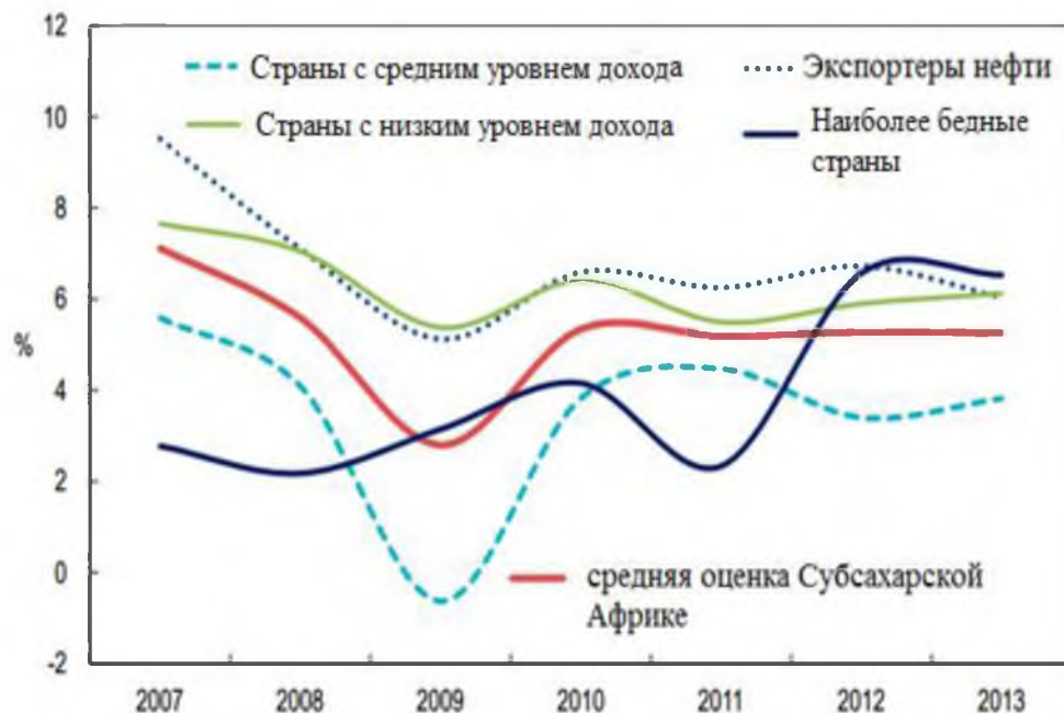
Рис. 2. Дифференцированный рост ВВП по различным группам стран Субсахарской Африки, %

доходов, в период с 2010 по 2013 гг, имели стабильные уровни роста ВВП, то в наиболее бедных странах произошел сильный прирост ВВП с 2 до 7%, а в странах с средним уровнем доходов – небольшой спад роста ВВП в 2012 г.