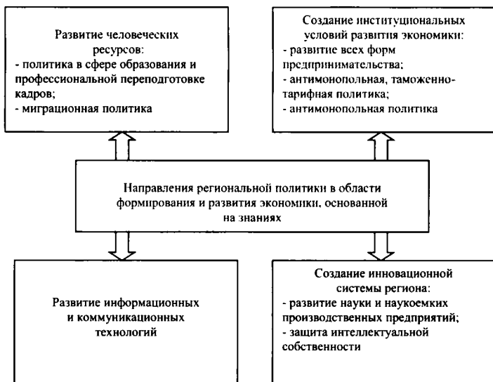
Рис. 2. Основные направления региональной политики в области формирования и развития экономики, основанной на знаниях

Ряд экономистов придерживаются мнения, что важное место в теории регионального управления занимает концепция информационного ресурса, как элемента интеллектуального капитала региона. Так как интеллектуальный капитал можно выделить в качестве основы для получения конкурентных преимуществ не только отдельных предприятий, но и региона в целом, источником пополнения этого капитала считается информационный ресурс. Выполняя многообразные функции, он является основой для получения нового знания на основе выявления скрытых закономерностей.